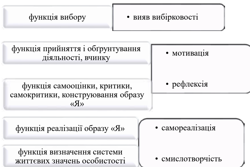
Рис. 2. Особистісні функції студентів

Згідно з теорією особистості С. Рубінштейна [7, с. 156], суть особистості виявляється в її здібності займати певну позицію. Виходячи з цього, особистість є не набором заданих якостей, а здатністю людини «бути особистістю», тобто проявляти своє ставлення до світу і самого себе. Саме тому особистісно-орієнтована освіта – це створення умов для виявлення особистісних функцій студентів: