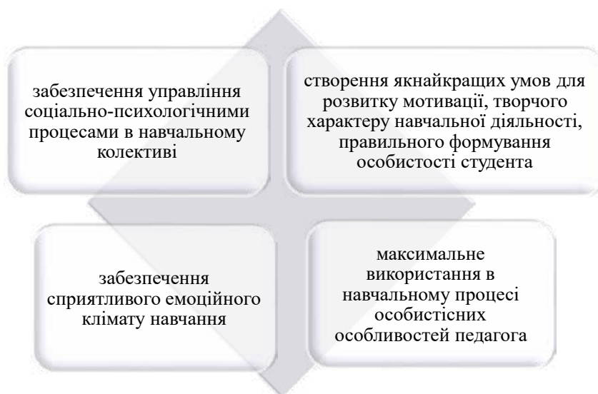
Рис. 1. Основні функції педагогічного спілкування

Отже, педагогічне спілкування – це взаємодія двох (або більше) людей, учасників навчально-виховного процесу, направлена на узгодження і об'єднання їхніх зусиль з метою налагодження контакту і досягнення загального результату в навчально-виховній діяльності. Якісна характеристика педагогічного спілкування, орієнтованого на особистісні особливості – оптимальне педагогічне спілкування. Відтак, виділяються такі основні функції спілкування з боку педагога: (рис. 1)