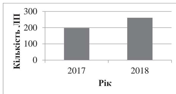
Рис. 1. Кількість лікарських препаратів за програмою МОЗ «Доступні ліки»

З початку 2018 року 202 аптеки Одеської області стали учасниками урядової програми «Доступні ліки». У березні долучилося ще 80 аптек. Наразі укладено понад 160 договорів і виписано близько 120 тисяч рецептів, з них за 84 тисячами здійснено часткове відшкодування вартості. Більша кількість рецептів (до 82%) була призначена пацієнтам з серцево-судинними захворюваннями. Завдяки реалізації програми «Доступні ліки» зменшилася кількість госпіталізацій з діагнозом інсульт на 7%, що було відзначено у звіті департаменту охорони здоров'я Одеської облдержадміністрації [6].