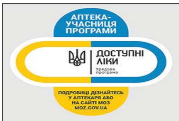
Рис. 3. Наклейка для аптеки

Департамент охорони здоров'я Одеси звертає увагу одеситів на те, що передусім потрібно звернутися до свого сімейного лікаря, тобто в Центр первинної медично-санітарної допомоги (ЦПМСД). Їх у місті налічується одинадцять. Лікар виписує рецепт, за яким пацієнт отримує лікарські препарати безкоштовно або з частковою оплатою в аптеках, які належать до відповідного ЦПМСД. Аптеки, які приймають участь в програмі «Доступні ліки», мають спеціальні наклейки (рис. 3).