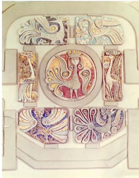
Малюнок № 2. Монументальна композиція «Фенікс» (фрагмент). Автор – Г. Севрук (готель «Русь», 1980 р.)